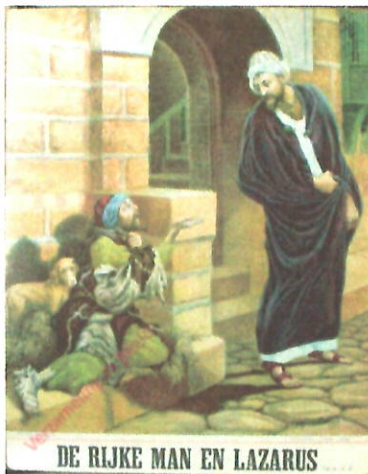
DE RIJKE MAN EN LAZARUS

De woorden hierboven zijn afkomstig uit de gelijkenis van de rijke man en de arme Lazarus (Lucas 16: 19 - 31). Jezus vertelt dat er een wijde kloof tussen de rijke man en de arme Lazarus tijdens het leven is. Die is onoverbrugbaar